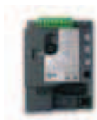
RBA4 Logique de rechange pour RDKCE.