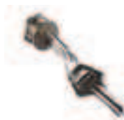
CM-B Loquet avec deux clés métalliques de débrayage.